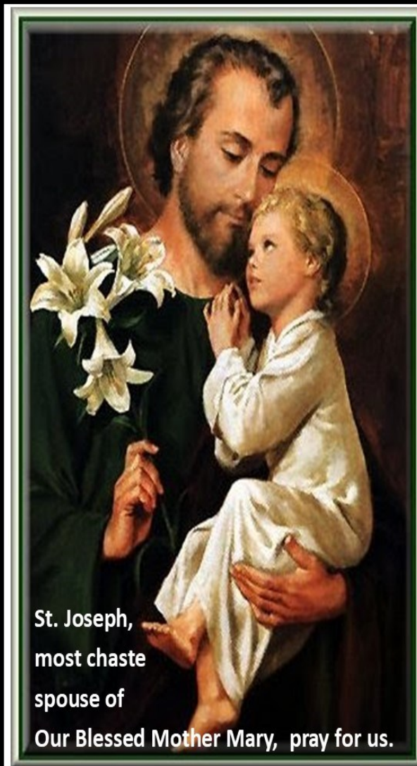
St. Joseph, most chaste spouse of Our Blessed Mother Mary, pray for us.

Pope Francis has declared a Year of St. Joseph from December 8, 2020 to December 8, 2021